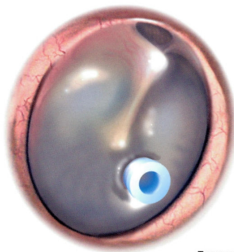
Trommehinde med dræn

Efter 1/2-1 år skubbes drænet ud af trommehinden, og hullet lukker af sig selv.